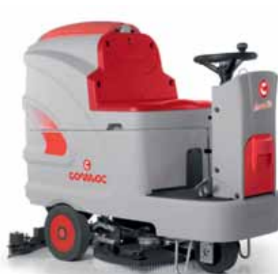
Innova 60 B