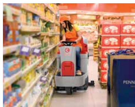
Fácil sustitución de las gomas sin el uso de herramientas en la exclusiva boquilla de aspiración Comac (Patent Pending)