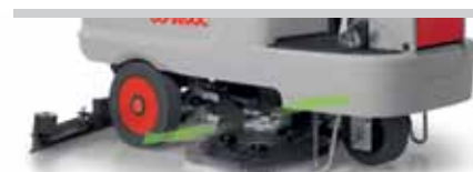
Innova 70 S

Innova 65/75/85 adoptan de serie un sistema que permite regular la pista de trabajo de 65 a 85 cm (Para mayor información, consulte el servicio de asistencia técnica)