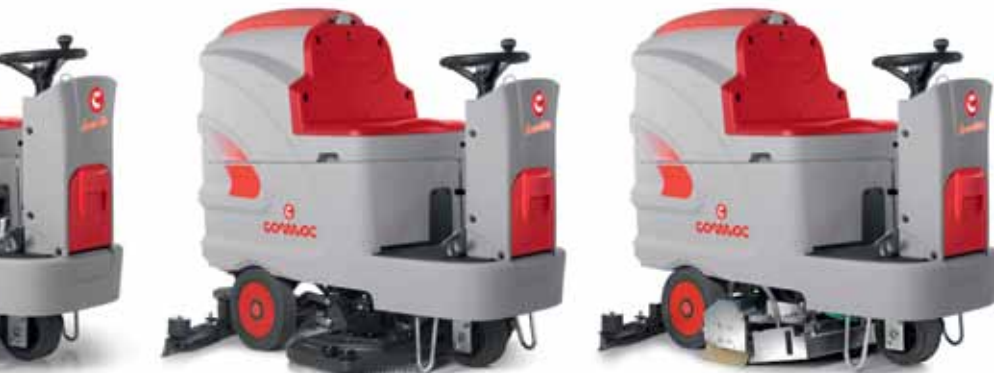
Innova 100 B

Un sencillo dispositivo (opcional) permite rellenar rápidamente el depósito del agua limpia sin la presencia del operador