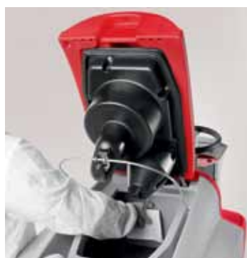
Completa sanificación de los tanques